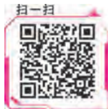
发展众创空间方面的政策

众创空间是顺应创新 2.0 时代用户创新、开放创新、协同创新、大众创新趋势，把握互联网环境下创新创业特点和需求，通过市场化机制、专业化服务和资本化途径构建的低成本、便利化、